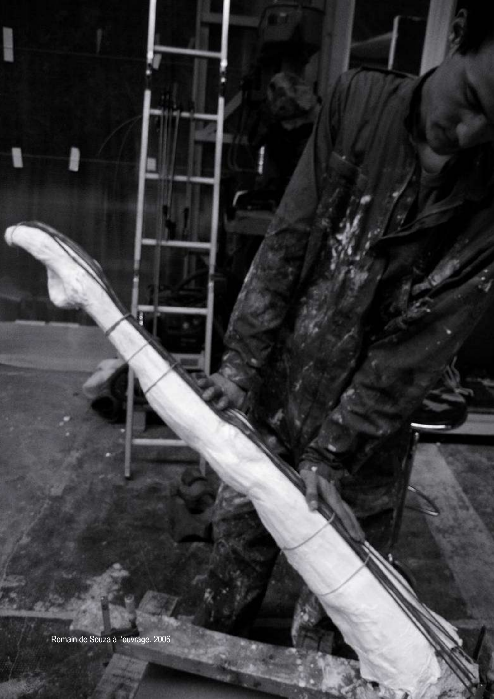
Romain de Souza à l'ouvrage. 2006