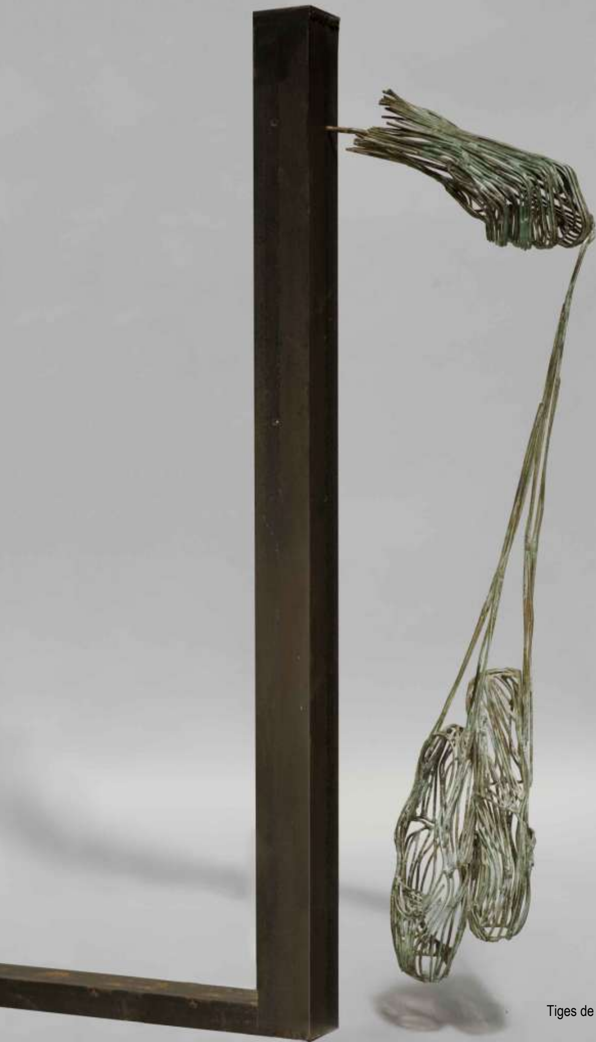
Chaussons Tiges de laiton patinées vert de gris 2006