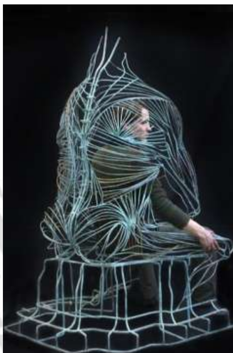
La chaise humaine Diplôme de fin d'étude, école Boulle Félicitations du jury 2004