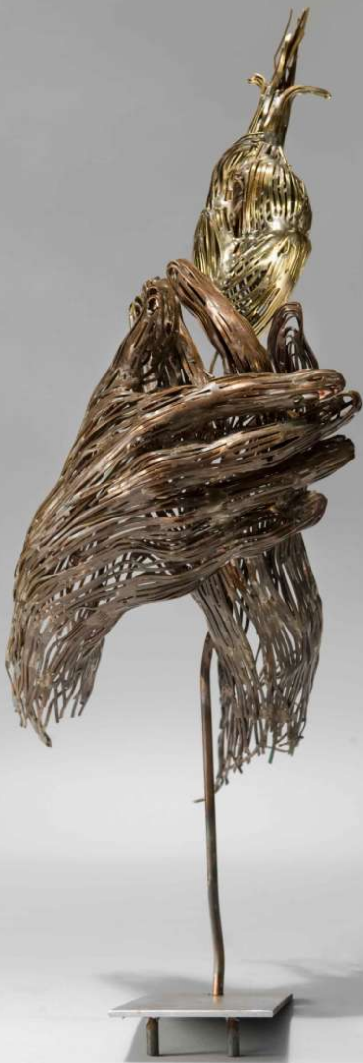
Palpitation Méplat de laiton cuivré, poli 2009