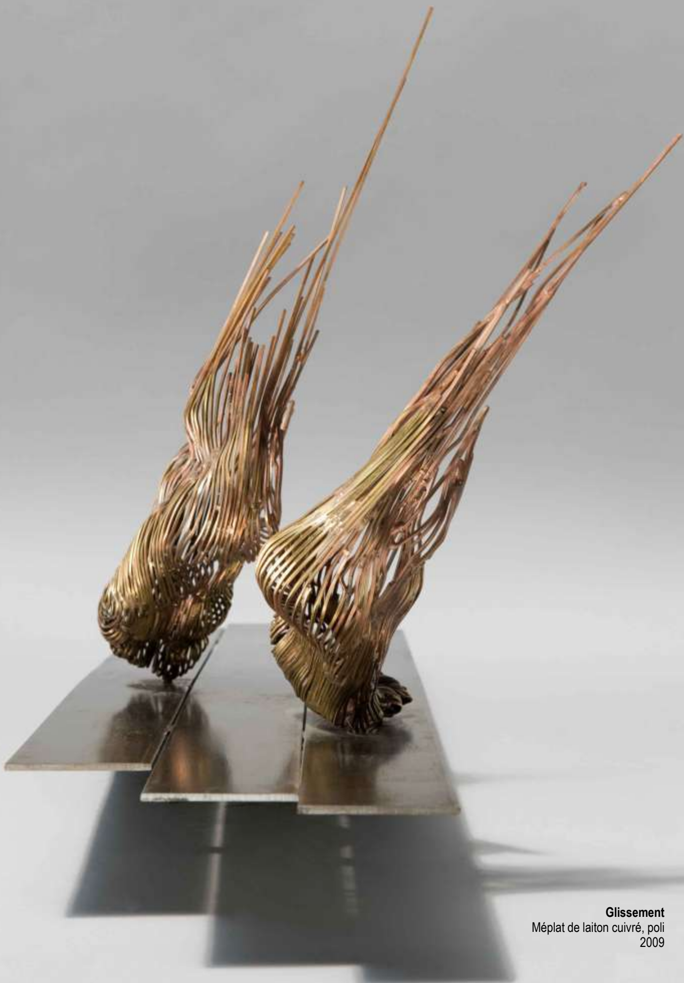
Glissement Méplat de laiton cuivré, poli 2009