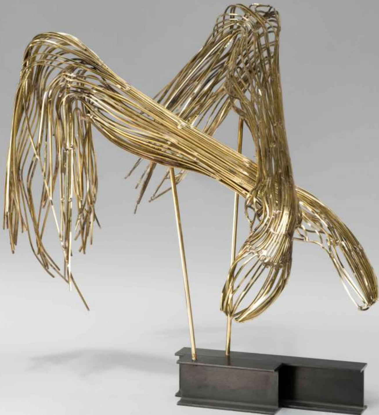
Marionnettiste Tiges carrées de laiton poli 2007