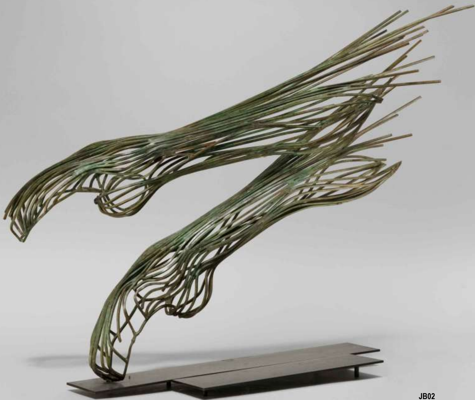
JB02 Tiges carrées, patine vert de gris 2006