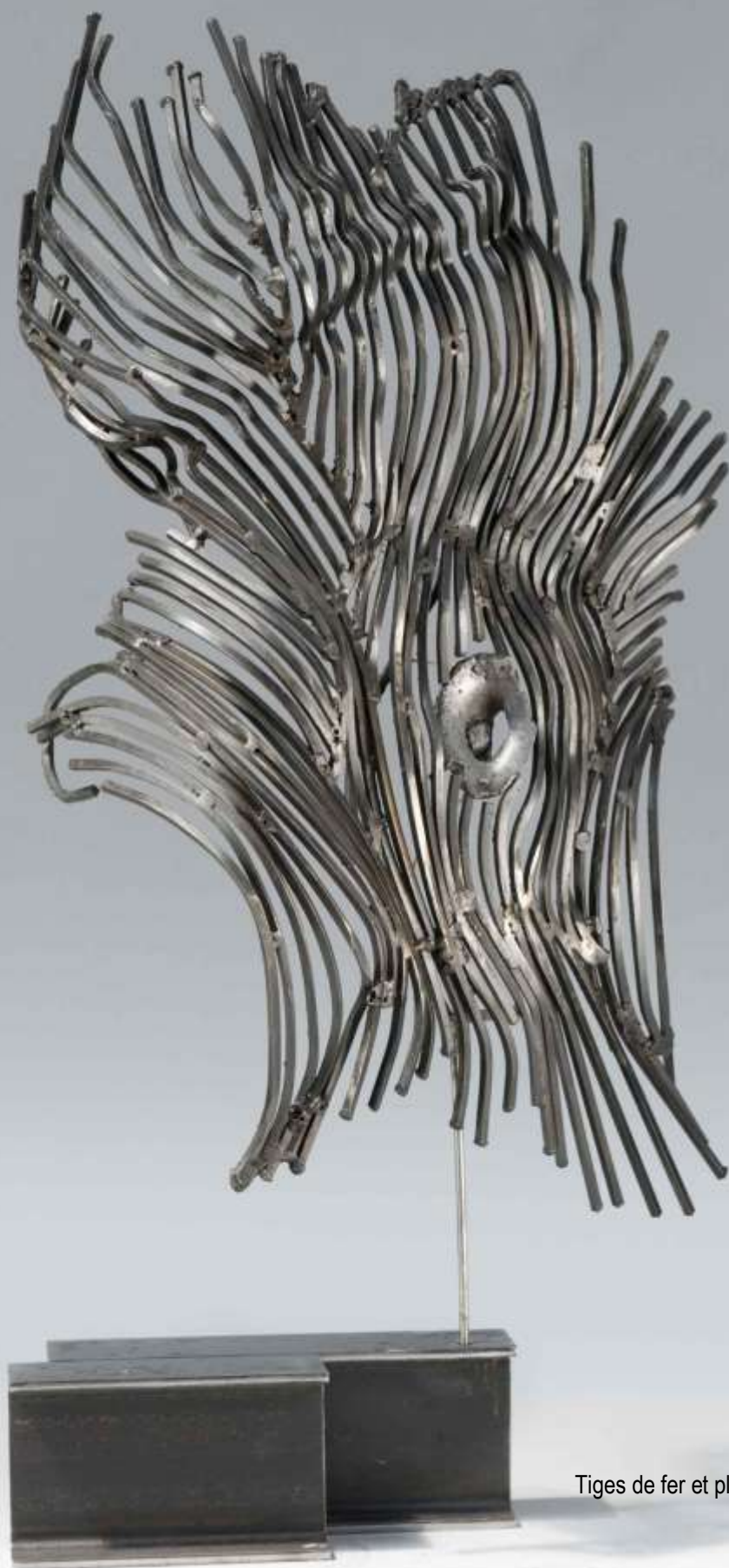
Nombriil plombé Tiges de fer et plomb, patine ferronnerie 2009