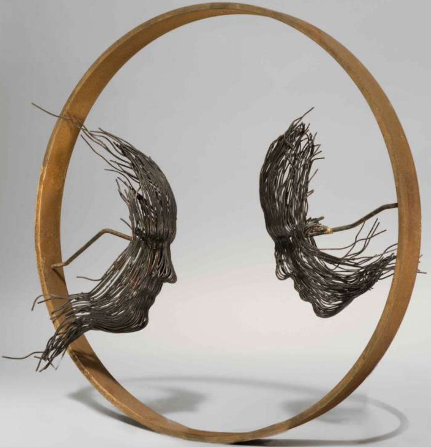
Conversation fraternelle Fil de cuivre, patine ferronnerie, acier rouillé 2008