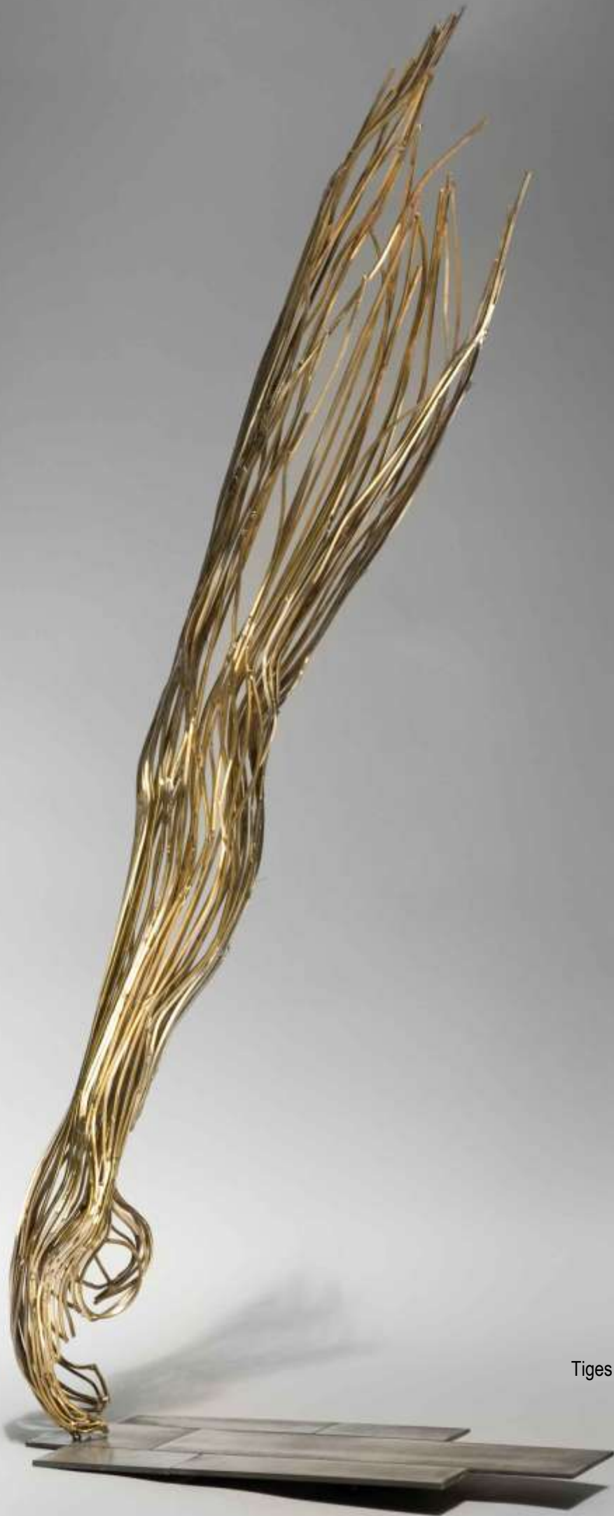
Elan Tiges carrées de laiton poli 2007